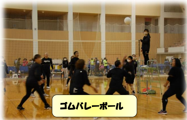
ゴムバレーボール