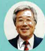
神戸大学名誉教授 神吉 賢一