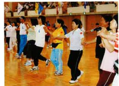
〇〇年前を思い出した 懐かしのフォークダンスでした