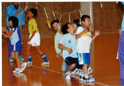
こんなの簡単と思ったんだけど…

スポーツの秋、第8回クラブ交流スポーツカーニバルが内容も一新され、開催されました。今回は、誰でも参加できる運動会形式の競技種目で行われました。