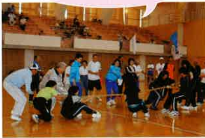
あ〜引っ張られる〜もうダメ (>_<)