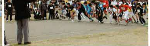
エンジョイ駅伝競走