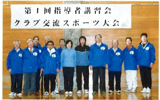
第1回指導者講習会 クラブ交流スポーツ大会

もちろん部員だけでは成り立たない広報部活動です。会員の皆さんからの情報・ご意見をお待ちしておりますので、どうぞ積極的にご参加ください。