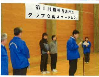
第1回指導者講習会 クラブ交流スポーツ大会