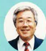
神戸大学名誉教授 神吉 賢一