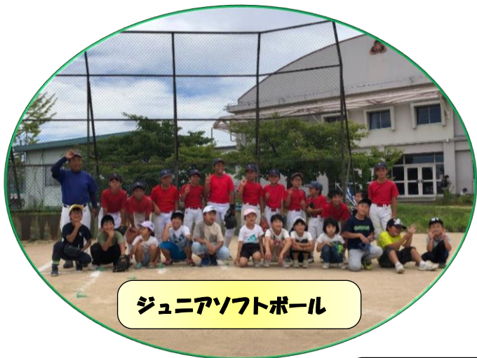
ジュニアソフトボール

キンボールスポーツ、バドミントン、ソフトボール、サッカーの体験教室を開催しました。小学校1年生から6年生まで、初めて体験する子どもたちも楽しく体験し、笑いあり、歓声あり、拍手ありの充実したスポーツ体験教室でした。