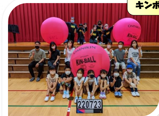
キンボールスポーツ