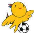
サッカー (成年女子)