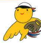
⑩ ソフトボール (少年男子)

「のじぎく兵庫国体」の成功にむけて、市民総参加の市民運動を目指していきます。 スポーツクラブの皆様のご協力をよろしくお願いします。