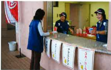
売店でのドリンクサービス