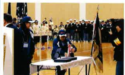
開会式でのお手伝い