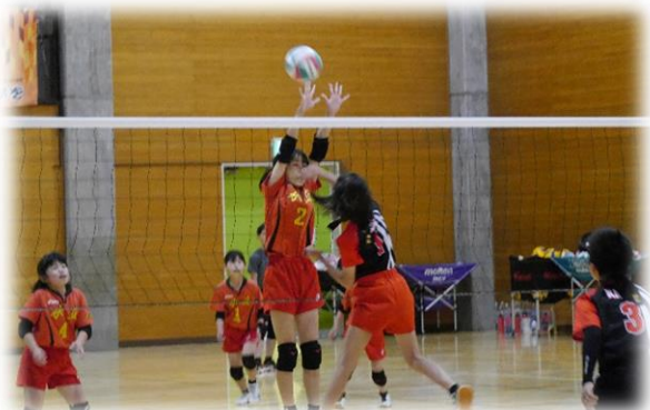
少年少女革バレーボール