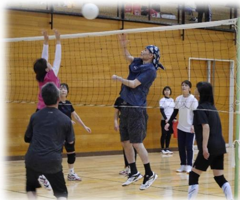
成人ゴムバレーボール