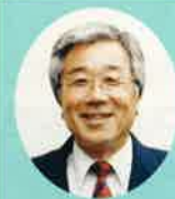
神戸大学名誉教授 神吉 賢一