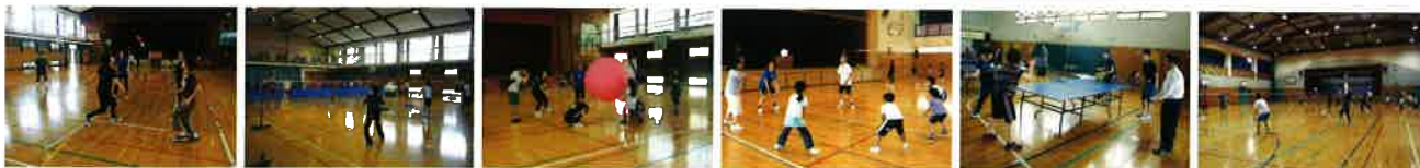
(東神吉南小) (野口南小) (平岡南小) (氷丘小) (上荘小) (別府西小)

スポーツライフセミナーは、運動・スポーツの楽しさや健康づくりの大切さを体験し、毎日生き生きと過ごすためのきっかけづくりとして加古川市教育委員会が開催しています。セミナーは、公民館コースと小学校コースがあり、各活動クラブのみなさんと加古川市スポーツ推進委員の指導のもとに、参加者の皆さんといっしょにスポーツを楽しみました。スポーツクラブでの実施内容は下記の通りです。