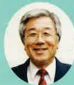
神戸大学名誉教授 神吉 賢一

平成20年3月に策定された加古川市の「スポーツ振興基本計画」には、目標年次である平成29年までに実現すべき数値目標が設定されています。勿論、国の計画見直しや社会情勢の変化を考慮して策定5年経過(平成24年)で中間評価をして計画を見直すことになっています。20歳以上の市民を対象にした数値目標は、①週1回以上運動・スポーツを行う市民の割合が、50%以上になることを目指す。現状38・1%↓50%以上。②全く運動・スポーツを行わない市民の割合が、25%以下になることを目指す。現状32・3%↓25%以下。③スポーツクラブや同好会に加入している市民の割合が30%以上になること。現状20・6%↓30%以上。④加古川総合スポーツクラブに加入している市民の割合が10%以上になる。現状3・9%↓10%以上。⑤競技場やスタジアムでスポーツを観戦する市民の割合が50%以上になる。現状43・2%↓50%以上。⑥スポーツボランティア活動を行う市民の割合が20%以上になること。など8項目があげられています。どの項目も市民アンケートにより現状を分析し目標数値が導き出されています。私たちの日々の生活をより元気に充実したものにするために、一市民として努力したいものです。