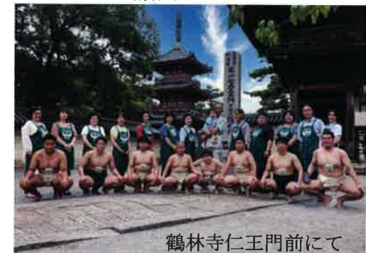
鶴林寺仁王門前にて